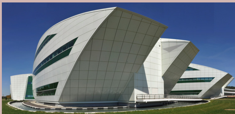
Laboratoires Pierre Fabre (vue extérieure)

Le CESER soutient le projet de Protonthérapie-Périclès dans ses dimensions médicales et industrielles. La protonthérapie est une technique de radiothérapie visant à détruire les cellules cancéreuses en les irradiant avec un faisceau de particules. Contrairement à la radiothérapie « conventionnelle », elle focalise un faisceau de protons sur les lésions et permet la destruction des cellules touchées tout en préservant les tissus sains avoisinants.